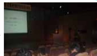
平成 21 年度 総会風景