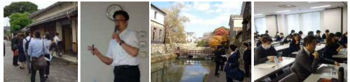
平成30年度 研究会・各WG会議の活動風景