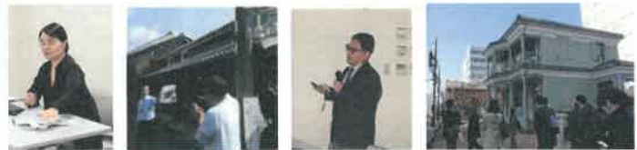
平成29年度 研究会・各WG会議の活動風景